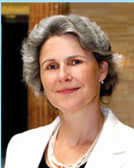
Barbara Rosenkranz, Abgeordnete zum Nationalrat, Familiensprecherin der FPÖ

Tatsache ist vielmehr, dass die Zuwanderung jährlich Hunderte Millionen unserer Steuergelder auffrisst. Gefängnisse sind überbelegt, Spitäler brauchen Übersetzer und Wirtschaftsflüchtlinge aus aller Welt werden bei uns durchgefüttert und auf Kur geschickt, während Pensionisten, aber